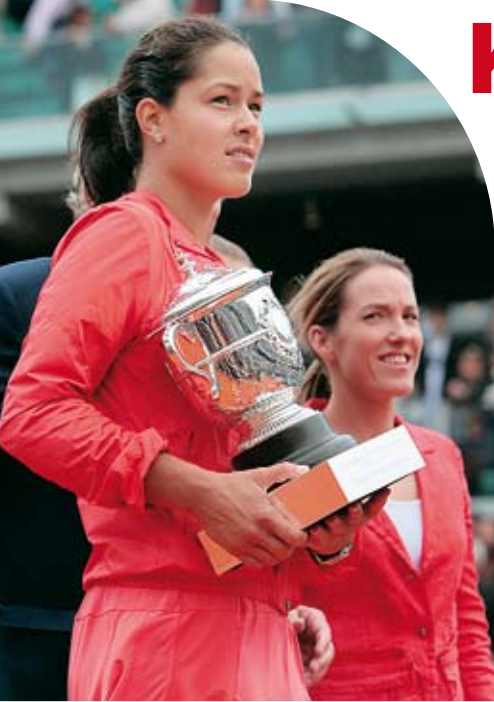
Ana IVANOVIČOVÁ preberala trofej od Justine HENINOVEJ. Symbolické – stala sa po Belgičanke nielen šampiónkou, ale aj svetovou jednotkou.

Ivanovičová – Schnyderová 63, 62, semifinále: Safinová – Kuznecovová 63, 62, Ivanovičová – Jankovičová 64, 36, 64, finále: Ivanovičová – Safinová 64, 63