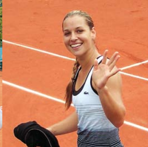
Roland Garros 2008