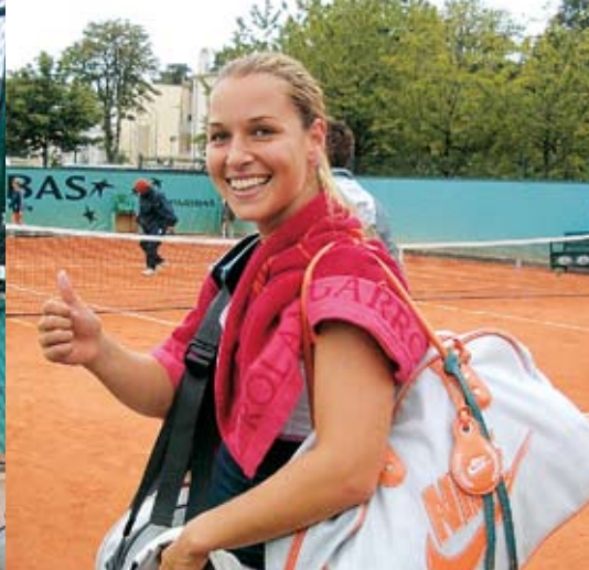
Roland Garros 2007