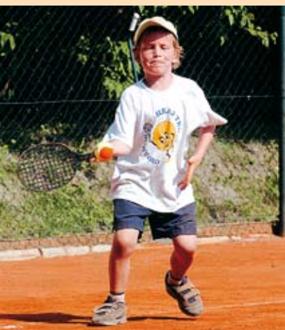
Deti hrali tenis s veľkým nasadením