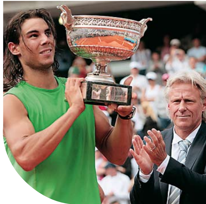
Rafael NADAL s Pohárom mušketierov, tleska mu legendárny Björn BORG