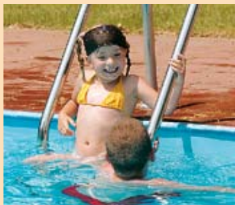
Osvieženie v bazéne