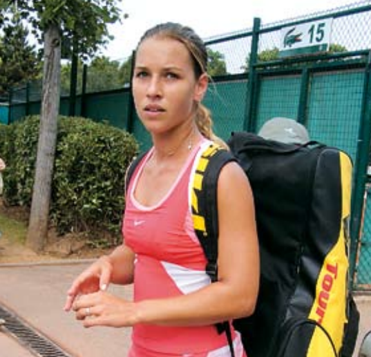
Roland Garros 2006