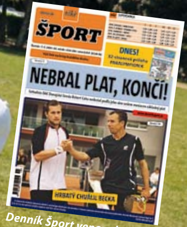
Denník Šport venoval titulnú stranu tenisovej extralige