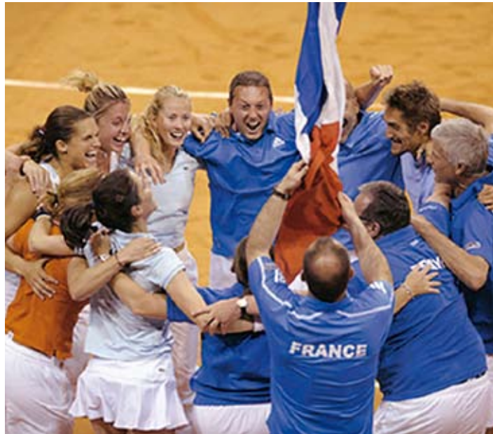
Radost Francúzska po víťazstve nad Slovenskom

Stretnutie Francúzsko – Slovensko trvalo 12 hodín a 27 minút. Aktérky súboja utvorili v dĺžke trvania nové maximum, ktorým prekonalí doterajších 10 hodín a 34 minút z vlaňajška, ktoré dosiahli hráčky v stretnutí II. svetovej skupiny Argentína – Rakúsko 3:2. Slovensko tromflo vlastný doterajší rekord v dĺžke stretnutia, ale aj pre Francúzsko je tento čas novým rekordom. Doterajším maximom pre tím SR bolo 9 hodín a 40 minút (predvlani stretnutie SR - Česko 0:5). Tím SR zároveň prekonal aj svoj rekord v celkovom počte gemov. V apríli 2001 ich proti Maďarkám (4:1) bolo 134, teraz 138. (r)