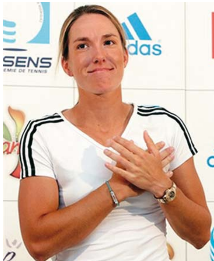
Justine HENINOVÁ oznamuje koniec kariéry

ninovej už pisali belgické denníky skôr. Spomínali únavu hráčky a hernú krízu, z ktorej sa nedokázala vymaniť.