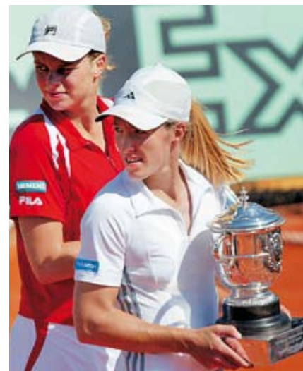
Justine HENINOVÁ a Kim CLIJSTEROVÁ, dve slávne Belgičanky, už skončili s tenisom