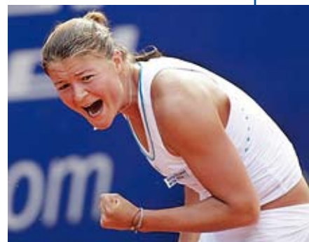
Dinara SAFINOVÁ, víťazka z Berlína