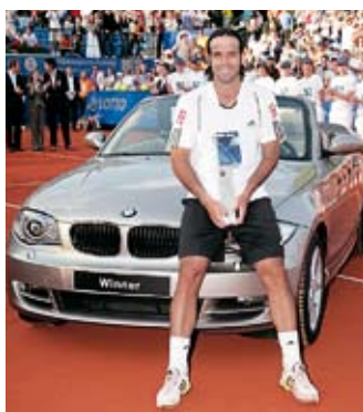
Fernando GONZÁLEZ sa teší z mníchovského titulu

– Nalbandian (6-Arg.) 57, 62, 62, Djokovič (3-Srb.) – Querrey (USA) 64, 60, Davydenko (4-Rus.) – Andrejev (Rus.) 63, 46, 75, Nadal (2-Šp.) – Ferrer (5-Šp.) 61, 75, semifinále: Federer – Djokovič 63, 32 skr., Nadal – Davydenko 63, 62, finále: Nadal – Federer 75, 75.