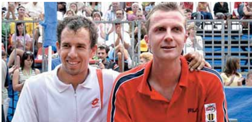
Momentka z roku 2007, keď si v rámci turnaja v Košiciach exhibične zahráli Dominik HRBATÝ a Karol KUČERA

Z kalendára, ktorý nám nahráva. V našom týždni sú dva turnaje na trávě - v Halle a Queense a iba dva antukové challengery - v Košiciach a Lugane. Vypadol 400-tisícový turnaj vo Varšave, a tak čakám veľký záujem hráčov. Finále bude opäť v sobotu, 13. júna, čo je výhodné