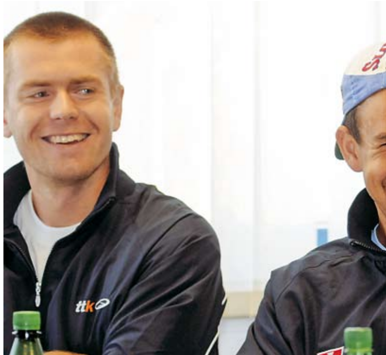
Dominik HRBATÝ sa vrátil do daviscupového tímu. Teší sa on, i jeho spoluhráči Michal Mertinák a Filip Polášek.