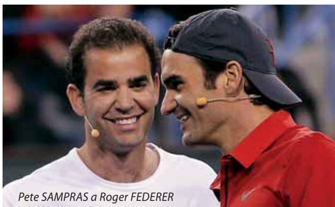
Pete SAMPRAS a Roger FEDERER

Federer už pred začiatkom Australian Open, tesne po ničivom zemetrasení na Haiti, počas niekoľkých dní presvedčil organizátorov grandslamového podujatia na usporiadanie exhibície, ktorá vyniesla pre postihnutú krajinu 600 000 dolárov.