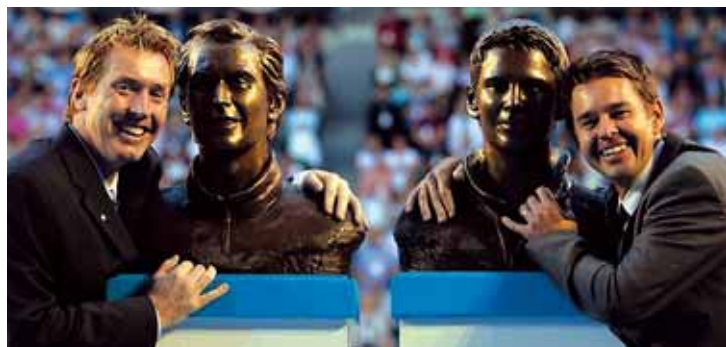
Mark WOODFORDE (vľavo) a Todd WOODBRIDGE so svojim bustami v Austrálskej tenisovej siene slávy v januári 2010. V júli ich uvedú do Medzinárodnej tenisovej siene slávy.