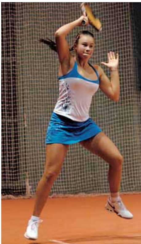
Valeria SAVINYCHOVÁ, ruská víťazka dvojhry