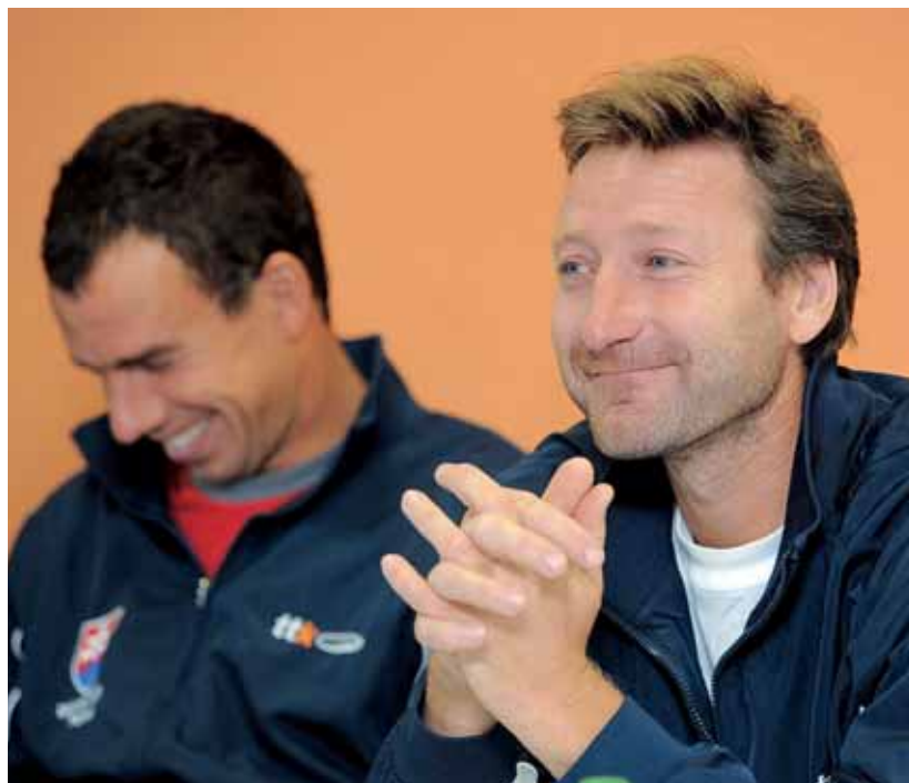
Miloslav MEČÍŘ, v pozadí Dominik HRBATÝ

Pevne verím, že bude fit. O jeho chuti hrať v Davisovom pohári všetci vieme. Jeho výkony v tíme sú