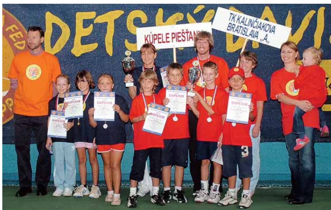
Vítané tímy Detského Davis Cupu a Fed Cupu s Nadáciou SPP na celoslovenskom finále 2008