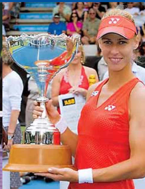
Jelena DEMENTIEVOVÁ odštartovala sezónu výhrou v Aucklande