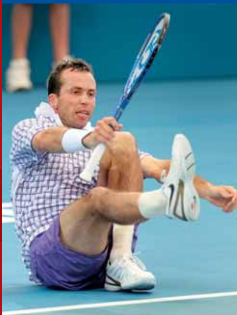
Obetavý Čech Radek ŠTĚPÁNEK, vítěz v Brisbane

Semifinále: Dementievová (1-Rus.) – Rezaiová (Fr.) 62, 62, Vesninová (Rus.) – Keothavongová (V. Brit.) 67(3), 61, 75, finále: Dementievová – Vesninová 64, 61.