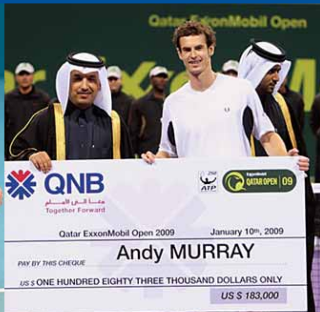
Andy MURRAY sa teší zo šeku za výhru v Dohu