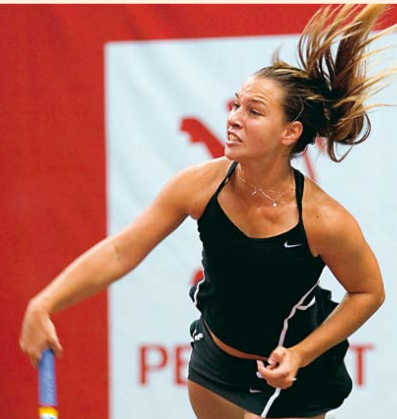
Dominika CIBULKOVÁ v tomto roku prerazila už do prvej päťdesiatky

Na záver by som ešte raz chcel potvrdiť to, čo bolo povedané na začiatku. Tenisový rok nám priniesol radosť i sklamanie. Sú výsledky, na ktoré môžeme byť právom hrdí, ale sú neúspechy i nedostatky, ktoré musíme stále odstraňovať. Za dôležité považujem to, že slovenský tenis má (na svoje pomery) veľmi slušný hráčsky potenciál a pri dobrej práci všetkých, ktorí majú vplyv na ďalší rozvoj hráčov, sa môžeme dočkať v budúcnosti ďalších dobrých výsledkov.