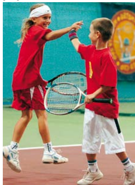
Typická detská radosť na finále

sporter športoviská 3. tisícročia www.sporter.sk