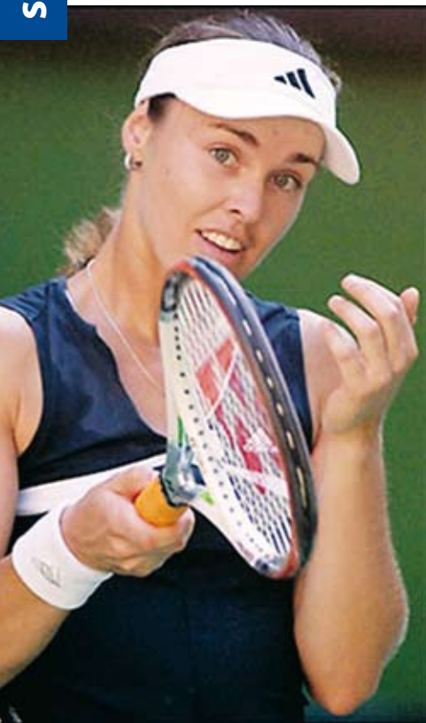
Blesk z jasného neba: Martina Hingisová ukončila po druhý raz kariéru.

Martina Hingisová prvý raz oznámila koniec kariéry roku 2003, ale vlni sa vrátila. Zdá sa, že tentoraz končí už definitívne – svet šokovala kokaínovou kauzou.