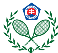
TK SLOVAN Slovenská sporiteľňa

a zbierali darčeky. Atraktívne bolo triafanie servisom do fľaš šampanského - kto trafil, získal fľašu. Vrcholom je vždy grilovanie a večerné tance pri živej muzike. Medzi pochútkami nechýbali ryby od známeho rybára Miloša Mečira, prezidenta Slovana, ale v ponuke boli i guláš, klobásy a burčiak. Najväčšiu zábavu na Slovane v takýto deň majú - ako prezrádza fotografia - deti.