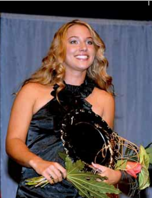
Dominik HRBATÝ, najpopulárnejší 2005, 2006