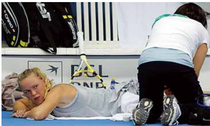
Ošetrovanie Caroliny WOZNIACKEJ

Dánska hráčka akékoľvek spojenie so stávkovaním odmieta: „Chcela som dať súperke šancu pred vlastným publikom ísť ďalej.“ Pokiaľ WTA uzná celú vec ako previnenie voči protikorupčným pravidlám, Wozniackej hrozí trest peňažnej pokuty alebo zastavenia činnosti.