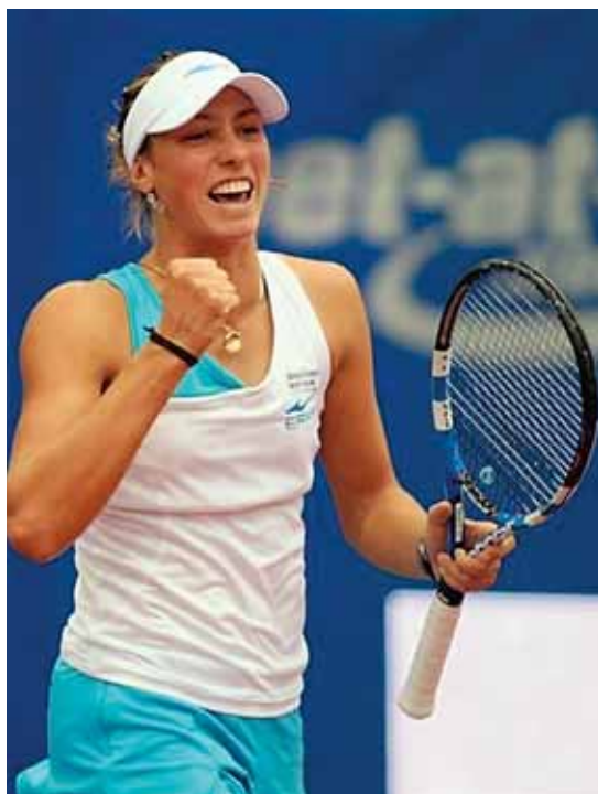
Yanina WICKMAYEROVÁ po víťazstve v Linzi

ujalo podobne ako Kuzy – Kuznecovová...) hovorí po francúzsky, anglicky a holandsky. Z komunikácie s ňou cítiť, že rýchlo dozrela. Tinedžerské roky si privedli neužila. Zato si teraz začína užívať tenisové úspechy. (zw)