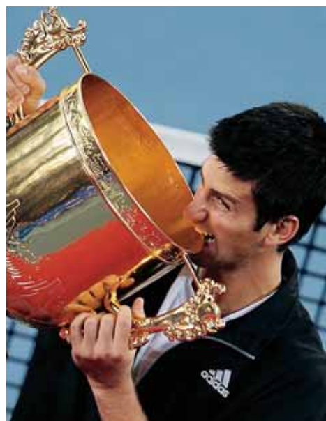
Novak DJOKOVIČ sa teší z víťazstva v Pekingu, teraz ho na koncoročnom vrchole v Londýne čaká obhajoba lanskeho šanghajského triumfu