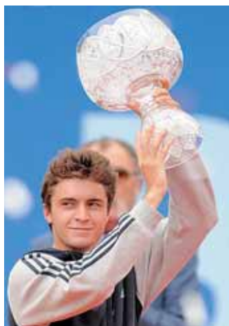
Francúz Gilles SIMON, víťaz turnaja v Bukurešti, ziskal v tomto roku na okruhu ATP už tretí titul, piaty v kariére

ATP WASHINGTON, DC, USA (508 000 USD, 11. 8.) Semifinále: Troicki (Srb.) – Kunicyn (Rus.) 64, 62, del Potro (2-Arg.) – Haas (4-Nem.) 62, 61, finále: del Potro – Troicki 63, 63.