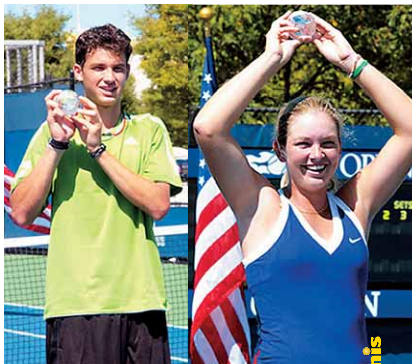
Grigor DIMITROV a Coco VANDEWEGHOVÁ, víťazi juniorky US Open