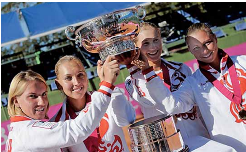
Víťaz Fed Cupu – zľava Svetlana KUZNECOVÁ, Jelena VESNINOVÁ, Jekaterina MAKAROVÁ, Vera ZVONAREVOVÁ

Šampión začne obhajobu titulu roku 2009 vo februári ako hostiteľ proti Číne, Španielsko cestuje za súperom do Česka.