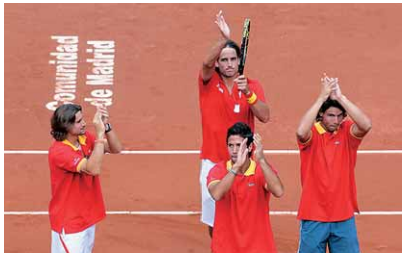
Španieli sa radujú – zľava David FERRER, Feliciano LOPEZ, Rafael NADAL, vpredu Fernando VERDASCO