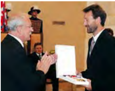
Rad Ľudovíta Štúra tenistom s. 4