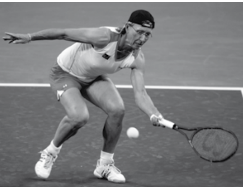
Martina NAVRÁTILOVÁ niekoľko týždňov pred svojou päťdesiatkou ukončila kariéru víťazstvo v mixe na US Open