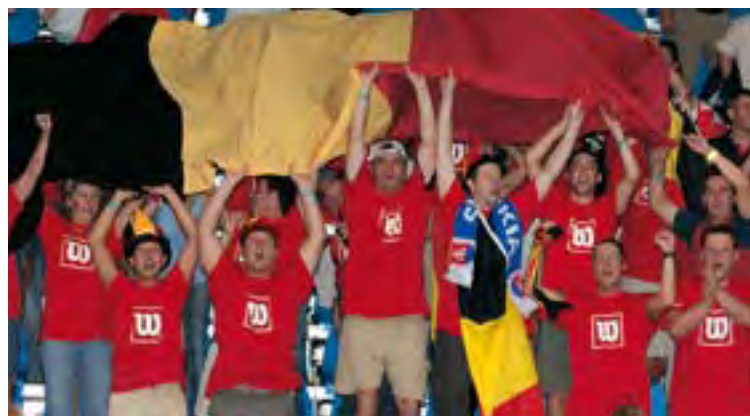
Päťdesiat belgických fanúšikov konkurovalo našim