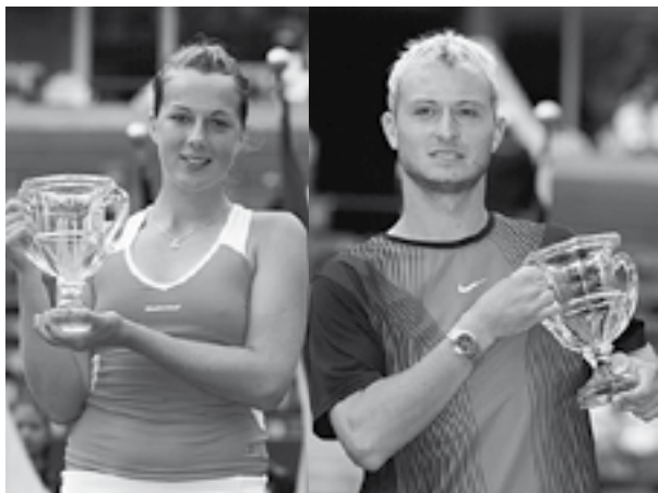
Anastasia PAVLUČENKOVÁ z Ruska, víťazka dvojhry junioriek na US Open