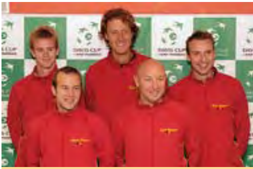
Davisov pohár: Belgičania nad naše sily s. 2, 3