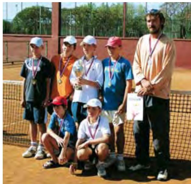
Družstvá rozhodli o tituloch majstrov Slovenska s. 27 - 29