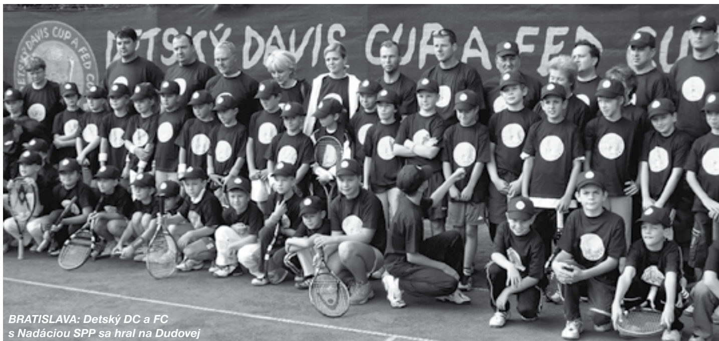
BRATISLAVA: Detský DC a FC s Nadáciou SPP sa hral na Dudovej