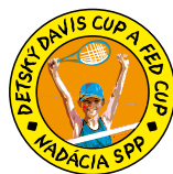
Pozvánka na Ritro Slovak Open s. 7