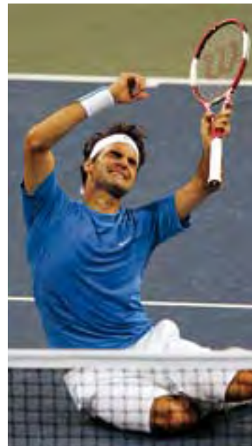
Deti sa tešia na finále s. 17 - 19