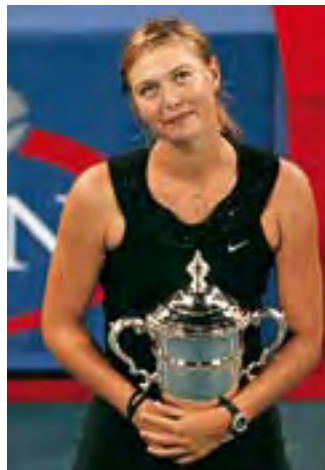
Vo Flushing Meadows vyhrali Federer a Šarapovová s. 15