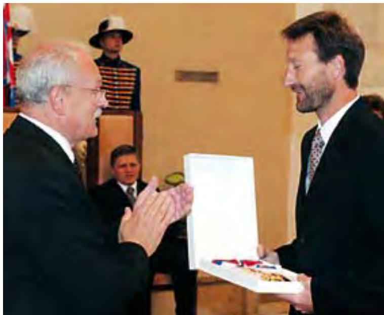
Kapitán slovenského daviscupového tímu Miloslav MEČÍŘ ocenený Radom Ľudovíta Štúra I. triedy prijíma blahoželanie prezidenta Slovenskej republiky Ivana Gašparoviča